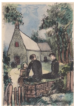
Illustration d'Émilien Dufour pour Mon Frère Yves (1937 Calmann Levy, Paris.).

Départ à 16 h 30 - Rendez-vous devant la chapelle de Bonne-Nouvelle en Melgven.