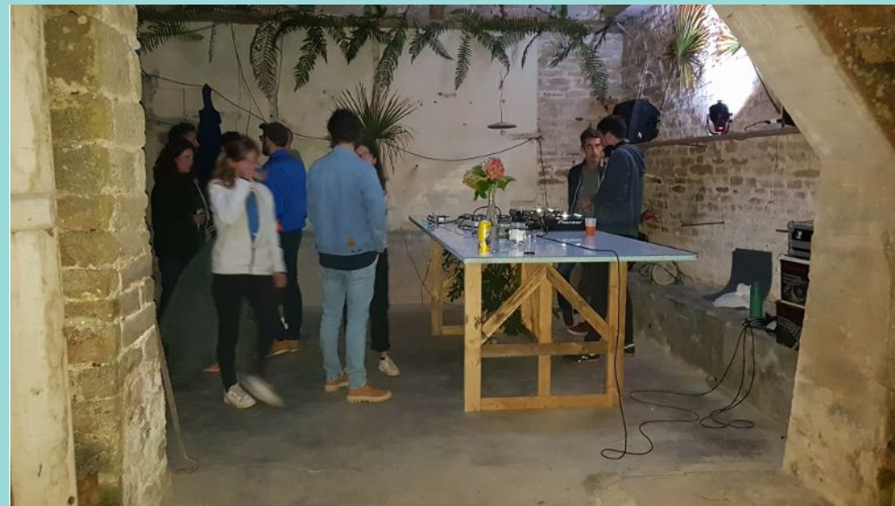
Le DJ s'affaire à ses platines