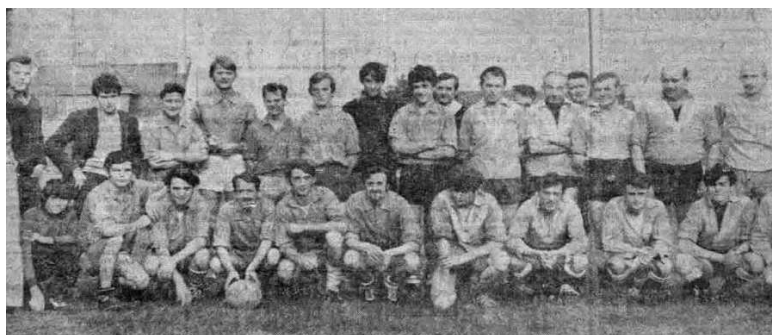
Rencontre Salaisons du jet / Caugant en 1972.

Il y a aussi des rencontres amicales entre équipes rospordinoises et des rencontres interservices au sein des entreprises.