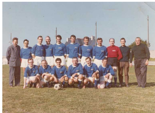
L'équipe Solitaire en 1970

Avec le développement des entreprises industrielles à Rosporden , on a vu apparaître des équipes d'entreprise, la première étant Mayola, bientôt suivie par Caugant, Leroy, Jeannès, Donval. Elles sont inscrites dans le championnat géré par la FSGT et évoluent dans le district de Quimperlé où elle rencontrent les équipes de Cascadec, Isoebox et les papèteries Mauduit.