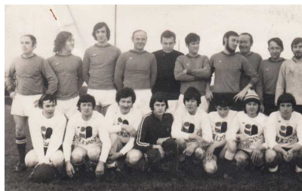
March Près verts contre Caugant en 1973. Collection particulière