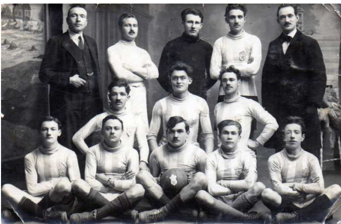
Equipe de l'Étoile - saison 1922/1923

Un terrain, acheté à la ferme du Bout du pont, route de Tourc'h, permet l'aménagement en 1922 d'un vélodrome avec un terrain de football au centre. La piste cimentée, inaugurée le 30 août 1931, accueillera les meilleurs coureurs nationaux pendant la décennie. La piste est démolie en 1945 permettant d'agrandir le terrain de football et de créer des couloirs de course à pied.