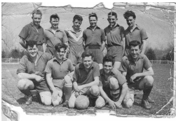
L'équipe des conserveries Jeannès en 1950

Avec le développement des entreprises industrielles à Rosporden , on a vu apparaître des équipes d'entreprise, la première étant Mayola, bientôt suivie par Caugant, Leroy, Jeannès, Donval. Elles sont inscrites dans le championnat géré par la FSGT et évoluent dans le district de Quimperlé où elle rencontrent les équipes de Cascadec, Isoebox et les papèteries Mauduit.