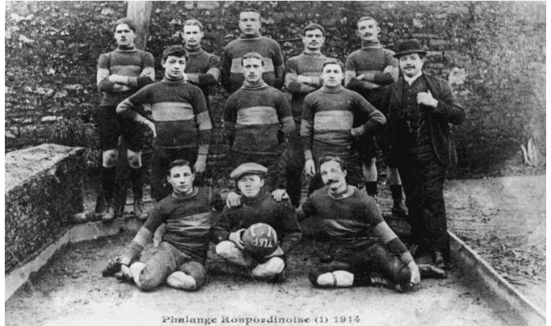
Equipe de La Phalange - 1914