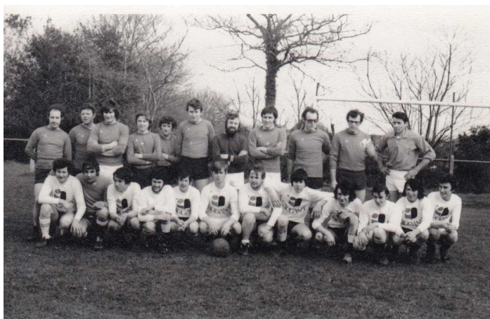
Match célibataires contre hommes mariés chez Caugant en 1976.

Il y a aussi des rencontres amicales entre équipes rospordinoises et des rencontres interservices au sein des entreprises.