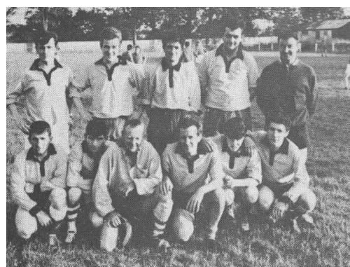
Photo de gauche : équipe Donval-loisirs atelier en 1966.