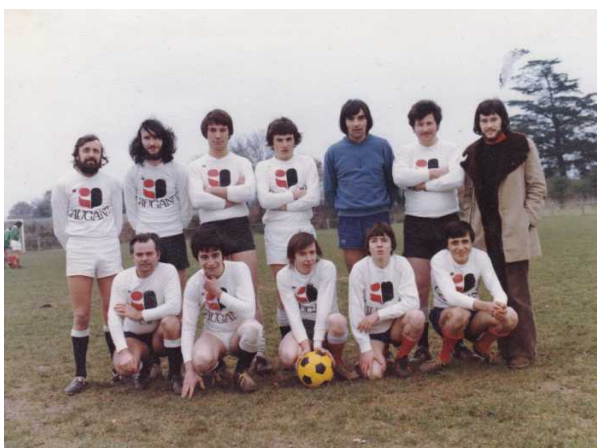
L'équipe Caugant en 1976.