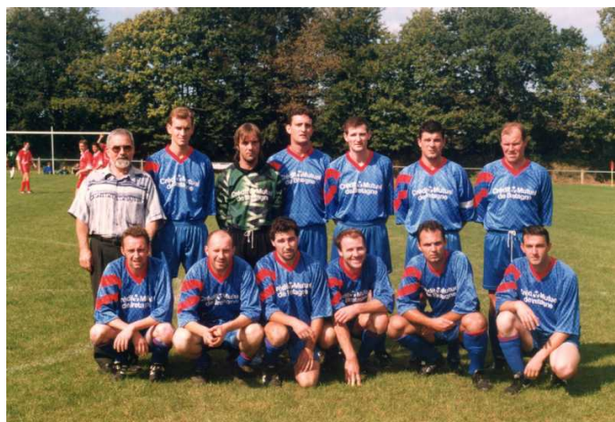
ASK. Années 1990