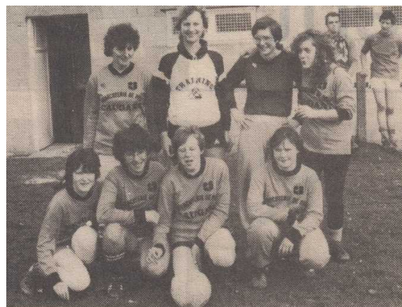
Photo de droite : Equipe féminine engagée dans le tournoi interservices Caugant en 1984.