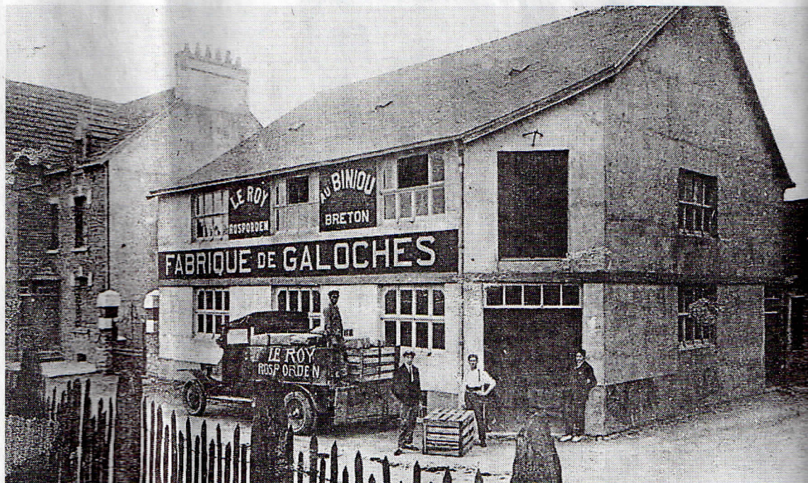
La galocherie Le Roy. L'usine, construite, en 1917 employait 105 employés, en 1 937. Les galoches, ces chaussures à semelle de bois étaient très recherchées.

« Nombreux sont ceux qui se souviennent également des récoltes et de l'éboutage des haricots, le soir, après l'école, et de la saison d'été aux conserveries pour se faire de l'argent de poche. On a rassemblé ces différents témoignages pour expliquer également les grands bouleversements qui ont ébranlé les secteurs économiques de l'époque. On est dans une démarche de travail de mémoire pour raconter une époque où il y avait 1 500 emplois industriels dans une bourgade qui comptait 5 000 habitants. Les entreprises devaient décaler leurs horaires afin d'éviter les embouteillages ! Puis la