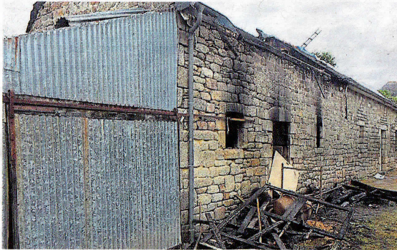
La longère, nouvellement rénovée, a subi de gros dégâts.

Les secours ont été appelés vendredi, à 18 h 24. Le feu avait pris dans les combles d'une longère située impasse de Gorréquer.