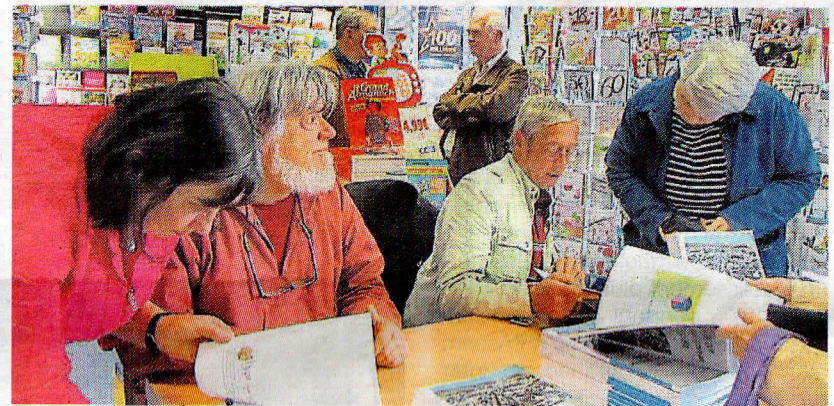
Beaucoup de monde samedi, pour découvrir l'ouvrage, « Rosporden, une histoire industrielle au XX e siècle ».

L'association Histoire et patrimoine du pays de Rosporden a réalisé un livre qui relate l'histoire industrielle de la commune, au XX e siècle. Les bénévoles ont animé une séance de dédicaces, samedi, à la Maison de la presse. De nombreux habitants ont apprécié d'acquiescer cet ouvrage qui fait un tour d'horizon des entreprises clés de l'époque.