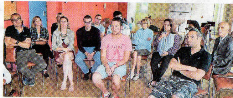
Réunis en assemblée générale vendredi soir, les adhérents des Orques ont notamment débattu sur l'âge minimum d'adhésion au club.

Autre sujet abordé, l'âge minimum des nageurs acceptés au sein du club. En effet, à l'heure actuelle, le club intègre des personnes sachant nager à partir de 16 ans, cependant, le club a