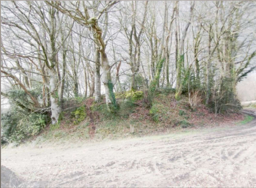
Motte castrale de Goarlot