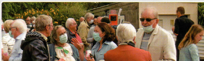
4 - Moments de partages et de discussions autour du vin d'honneur.