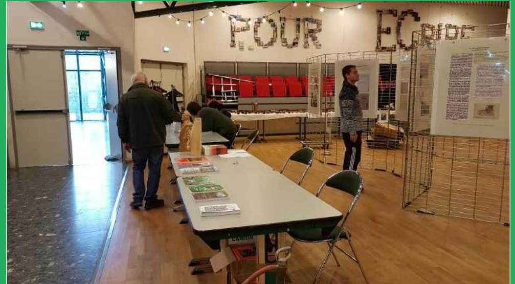
Un visiteur très studieux : il viendra même deux fois ! C'est un des pompiers de Rosporden.