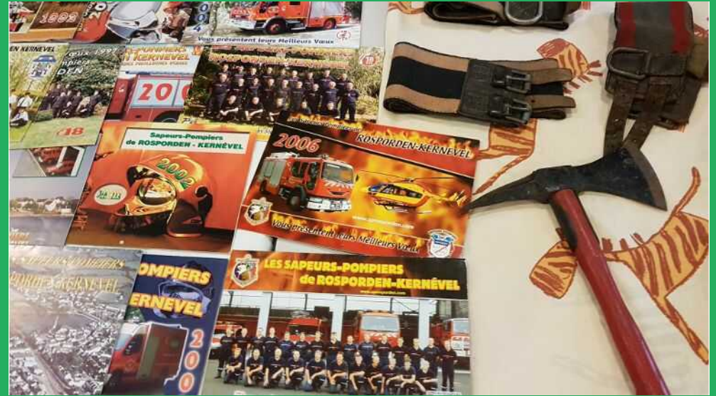
Collection des calendriers de 1951 à 2006 appartenant à Jean-Pierre GARO.