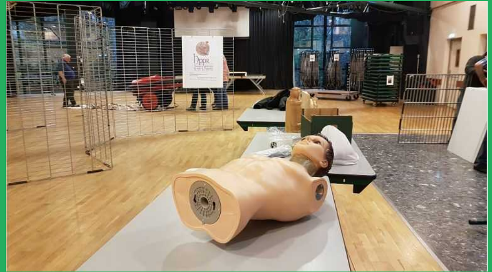
Installation de la... De Dion Bouton !