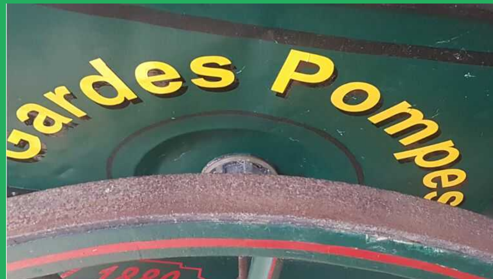
Quelques détails de la pompe à bras, venue de Trégourez