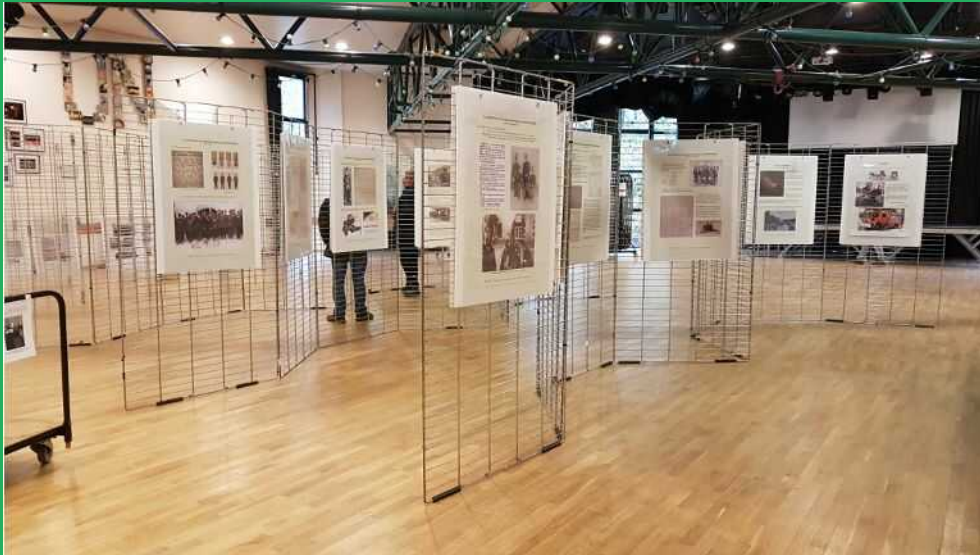
L'exposition commence à prendre forme...