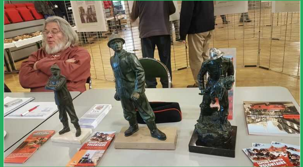
3 statuette de la collection de Jean-Pierre GARO