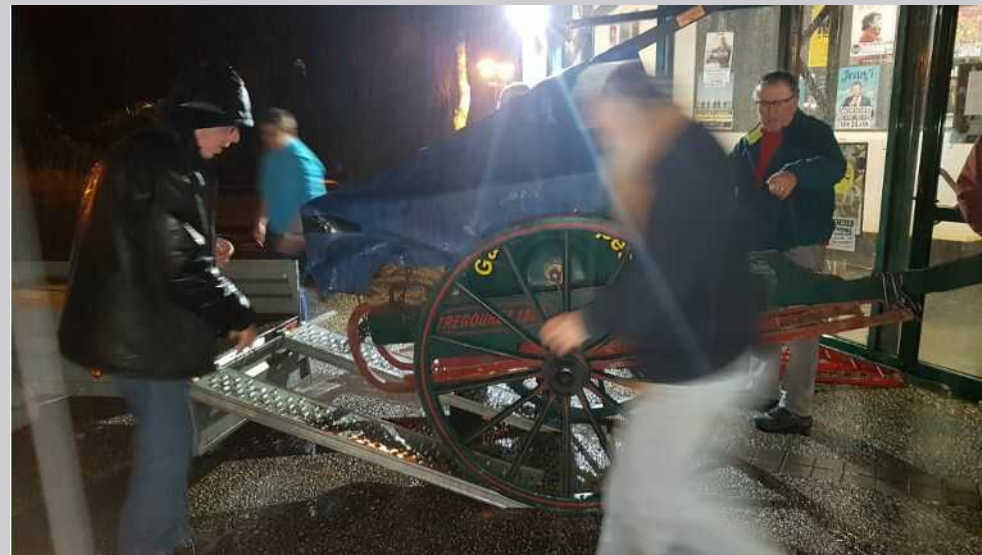
Déménagement, périlleux, du matériel... sous une pluie battante !