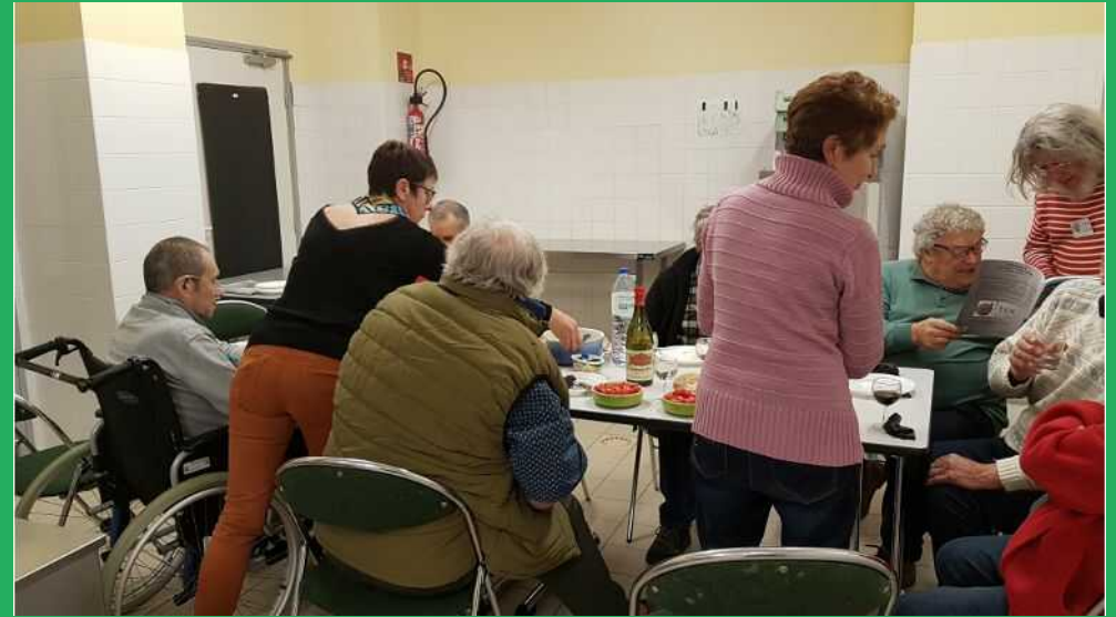
Pause casse-croûte pour le déjeuner...