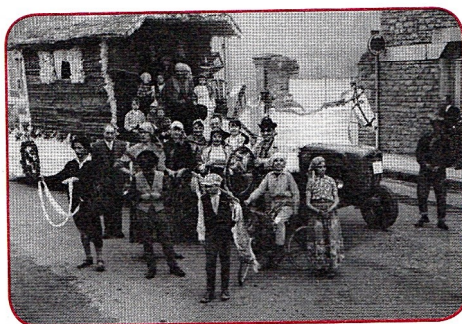
Char "La Bohème"