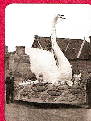
Char "Le Cygne"

Si vous possédez des photographies, documents ou toutes autres informations sur les Corso fleuris de Rosporden.