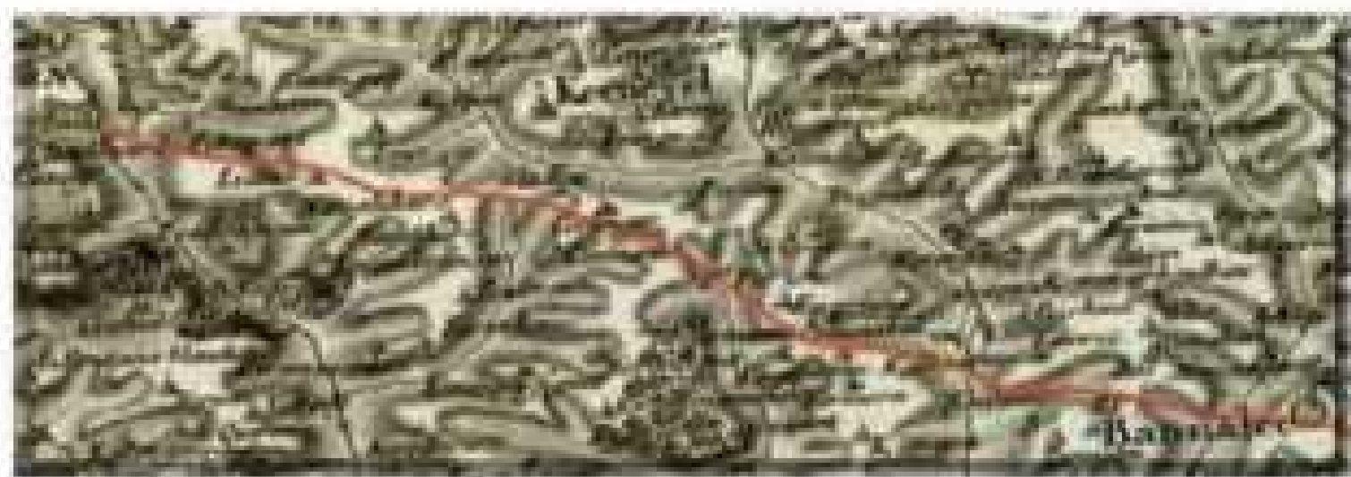
Extrait de la carte de Cassini : Rosporden-Bannaec