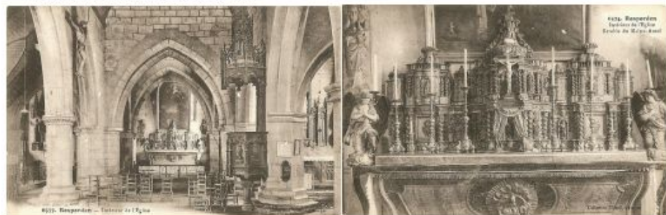
Das Innere der Kirche von Rosporden Anfang des 20. Jahr