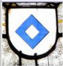
Blason de Tréanna