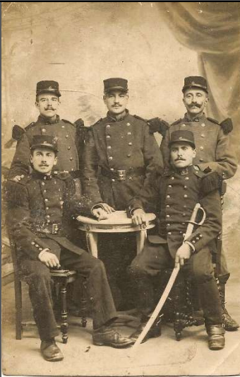
La Grande Guerre