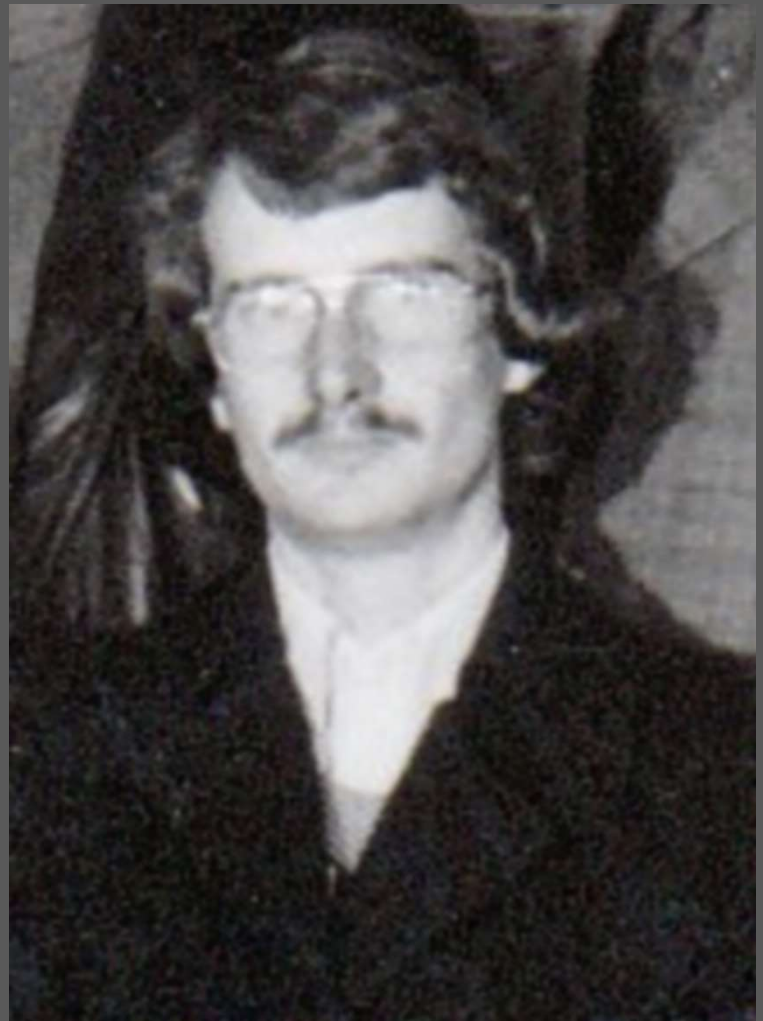
En 1975 avec les boulistes de Saint-Eloi

Une Seigneurie en Basse Bretagne. Histoire de la Terre et des Seigneurs de Reminihy 1370. 1790 De Villiers Du Terrage - 1906 - Bouygé. Imprimerie Dangeon en 8. 124 p.