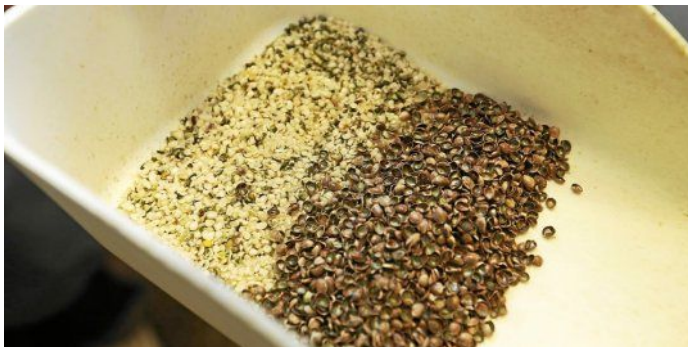
Graines et coques de chanvre.