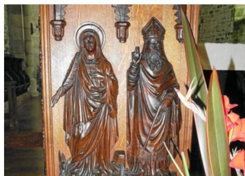
Sainte Candide et saint Alain sur le lurin de l'église. Ces sculptures, faites par l'atelier le Reste à la fin du XIX e siècle, décoraient autrefois la chaire à prêcher.

« Saint Alain, saint du pays de Scaër... » Ainsi commence le poème de Brizeux écrit « au mois de la moisson », en 1843. Une prière pour « reconforter les Bretons ». Dans ce poème aux accents révolutionnaires, il était question de la misère des paysans du XIX e siècle : « Sur nous toujours le travail, toujours la pauvreté ; le cœur de la terre, chaque jour, nous le perçons avec le fer, d'autres mangent le froment semé de nos mains ». Ce saint Alain, représenté sur un vitrail de l'église sous le blason de Quimper, aurait été évêque de Quimper, peu après saint Corentin. Il s'agirait d'un saint apocryphe de l'église bretonne, non reconnue par l'église romaine. Saint Alain est fêté le 9 septembre. Saint Candide, illustre la date du