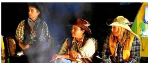
Dépaysement garanti ce soir chez Armoricamp avec une soirée western.

Exposition. À l'office de tourisme, les dessins de Pascal Le Lidec, samedi de 9 h 30 à 12 h 30.