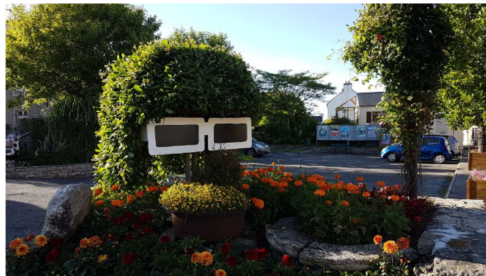
Un touriste inattendu : Michel Polnareff...