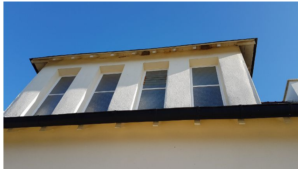
Même les hirondelles jouent les touristes !